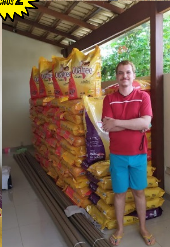
Imagens das entregas realizadas.