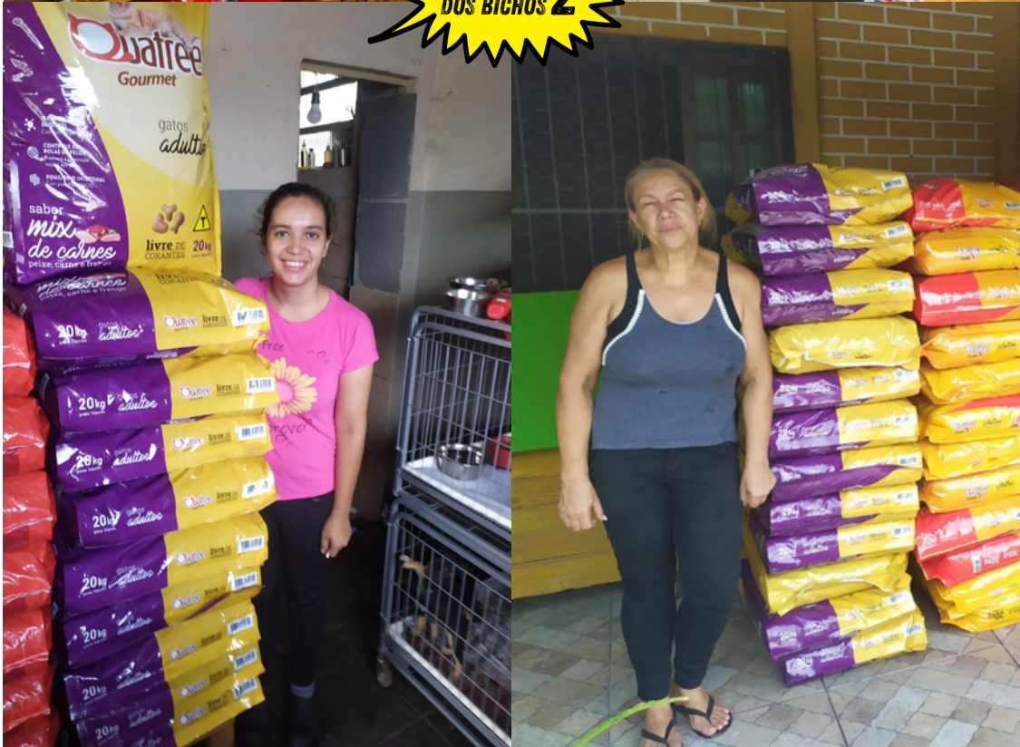
Imagens das entregas realizadas.