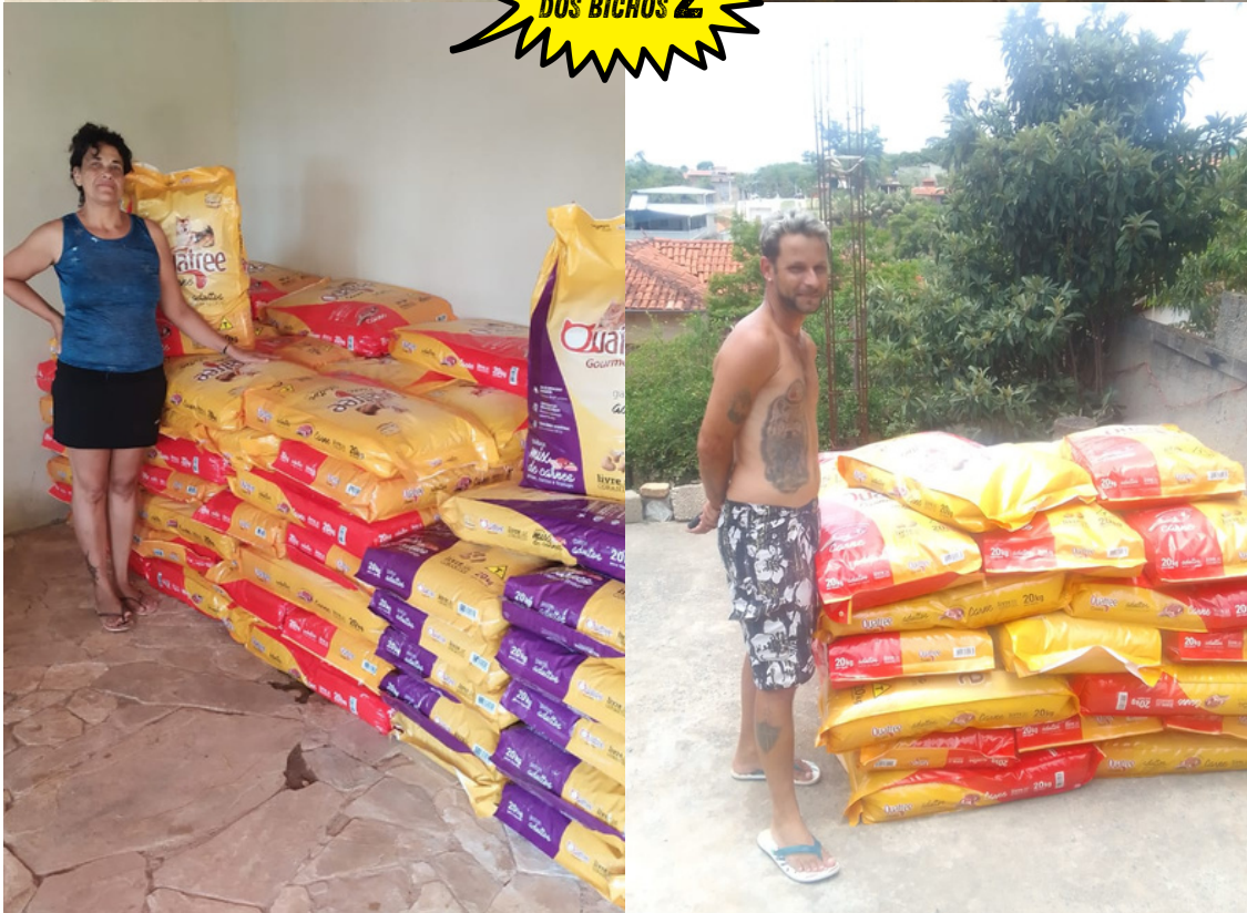
Imagens das entregas realizadas.