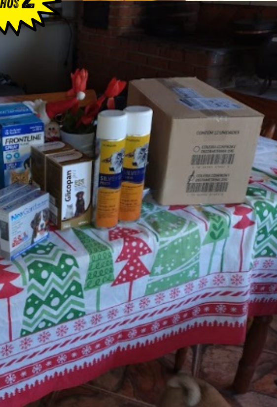
Imagens das entregas realizadas.